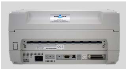
Vielzahl an Schnittstellen