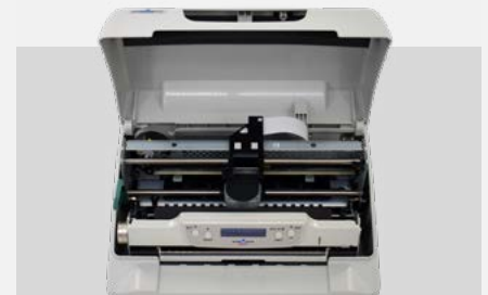
Austauschbare Verschleißteile und günstige Verbrauchsmaterialien